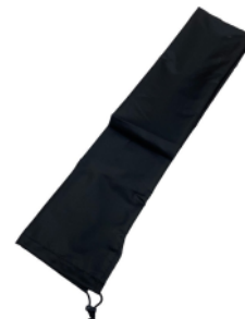
FUNDA para sistema winder