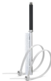
SOPORTE DE VALLA con rotador