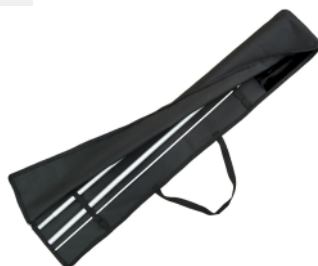
BOLSA DE TRANSPORTE para sistema winder