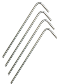
PIQUATES DE ACERO para bases independientes