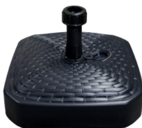
BASE ROLLENA DE AGUA 13L con rotador