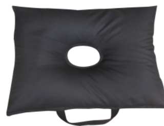
CARGA TEXTIL para bases independientes