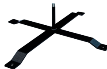
BASE DE REJA con rotador